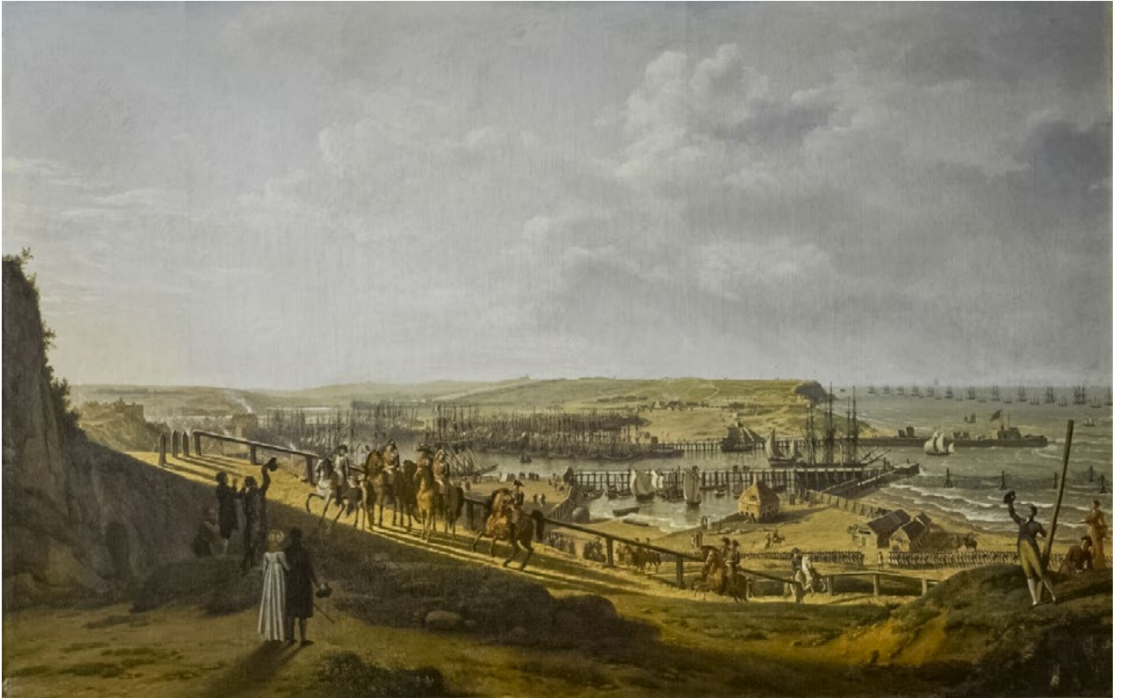
Napoleon I (1769-1821) bezoekt het kamp in de Boulogne in juli 1804. Schilderij, Jean-François Hue.