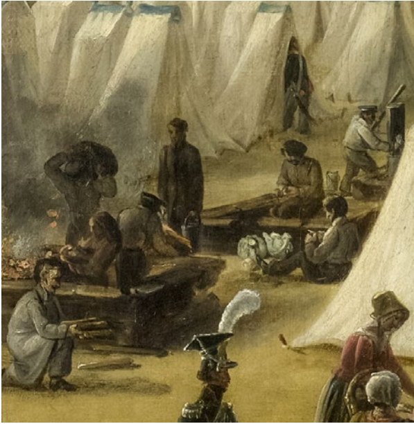
Kookgaten, uitsnede van een schilderij. Legerkamp van Nederlandse troepen te Rijen, in of na de Tiendaagse Veldtocht in 1831, anoniem, 1831-1835. Olieverf op doek. Rijksmuseum, Amsterdam.

tenten, tentpalen, bouwhout, timmeruitrustingen, gereedschappen en andere kampementsgoederen werden aangesleept, maar voor wat eigenlijk?