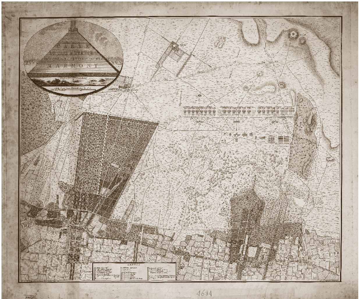
Kaart van het gebied tussen Zeist en Driebergen met het legerkamp van het Bataafse en Franse leger onder leiding van generaal Auguste de Marmont, 1804-1805.

de inval van de Republiek (door de Fransen “Hollandse oorlog” genoemd). 33 De koning en zijn direct gevolg verbleven in het dorp Zeist, vlakbij de kerk. De rest van het leger kampeerde in tenten vlakbij het dorp, aan de noordoostkant op de heide.