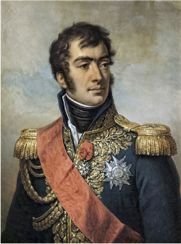
Auguste-Frédéric- Louis Viesse de Marmont, hertog van Ragusa, maarschalk van Frankrijk (1774-1852).

in dit geval het maken van een kamp. 7 8 De meningen over de wetenschappelijke en praktische staat van dit metier verschilden nogal want hoewel de veelzijdige en begaafde Pruisische koning Frederik de Grote er een heel exposé over schreef, waarbij hij zich bediende van het Franse castramétrie , waren er ook minder lovende