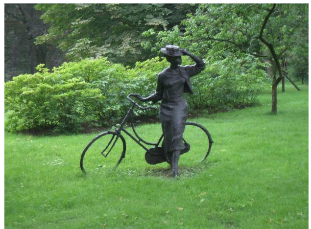
Beeld Juffer Annie bij het Molenbosch