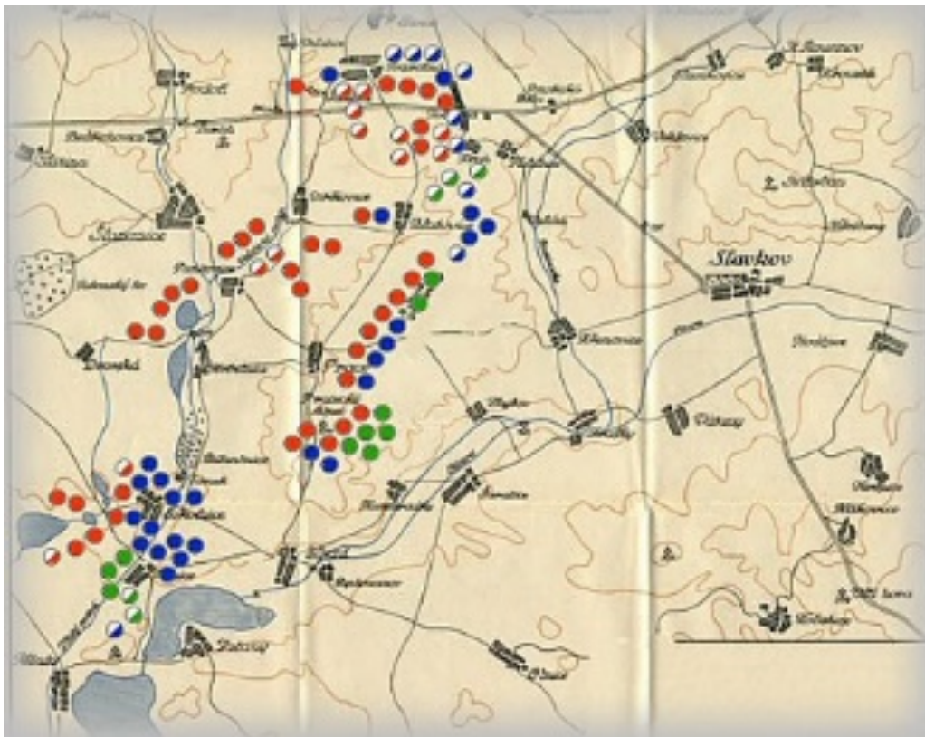
Positie om 10 uur a.m.