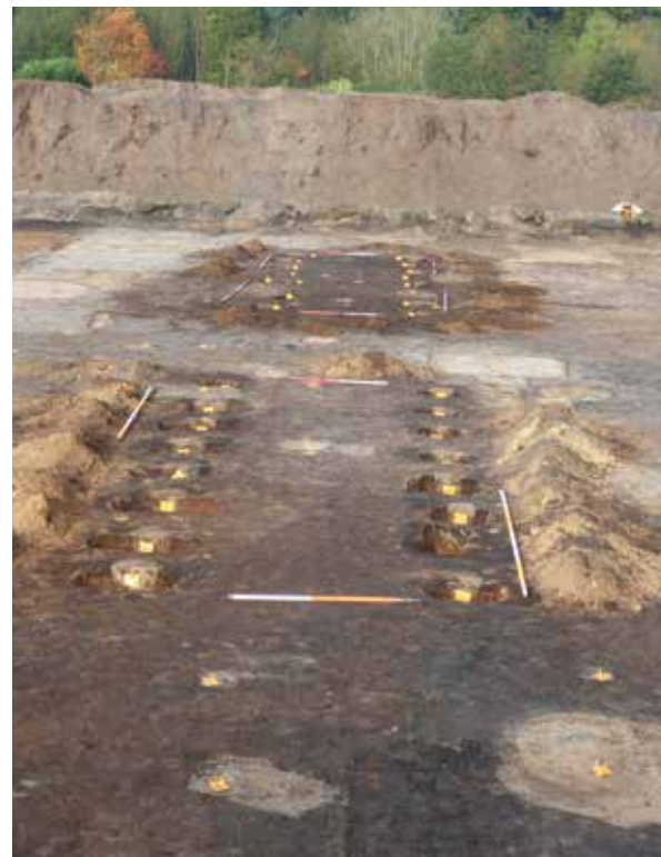
Afbeelding 7. Gebouwen met onbekende functie (zie afbeelding 9, rij 6).

In de periode tot aan de inrichting van het kamp in 1804 was het gebied rond Austerlitz een licht golvend heidelandschap, doorsneden met onverharde landwegen. Er woonden maar