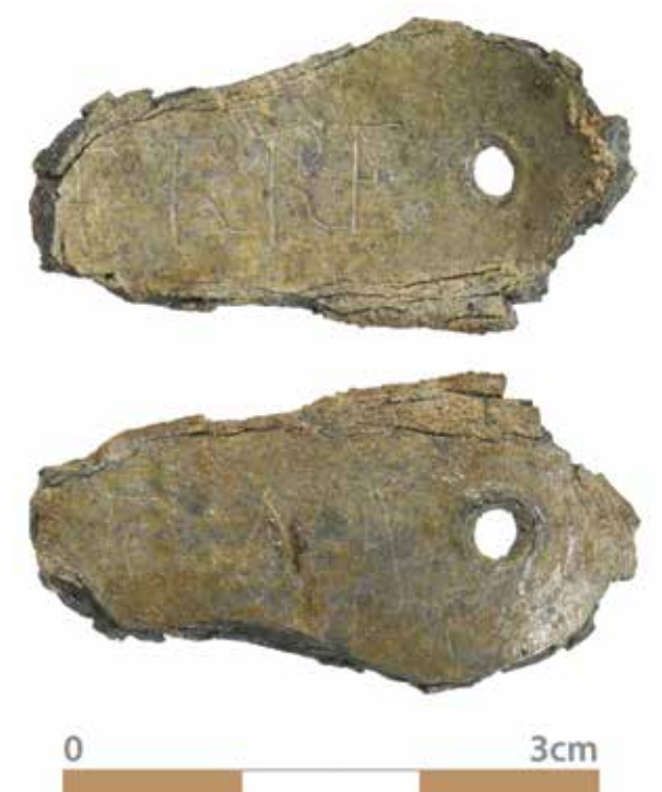
Afbeelding 13. Fragment lepel met ingekaste naam "(P)ierre".

bronnen zouden er 38 putten binnen het kamp zijn aangelegd. Hiervan is er één binnen de opgraving aangetroffen (afbeelding 11). Deze kon worden gedocumenteerd tot een diepte van 5,5 meter beneden maaiveld; onderzoek tot grotere diepte was technisch en om redenen van veiligheid niet mogelijk. Hoe diep de waterput oorspronkelijk is geweest, is niet bekend maar op basis van historische bronnen en de grondwaterstand moet rekening worden gehouden met een diepte van 12 tot 15 meter.