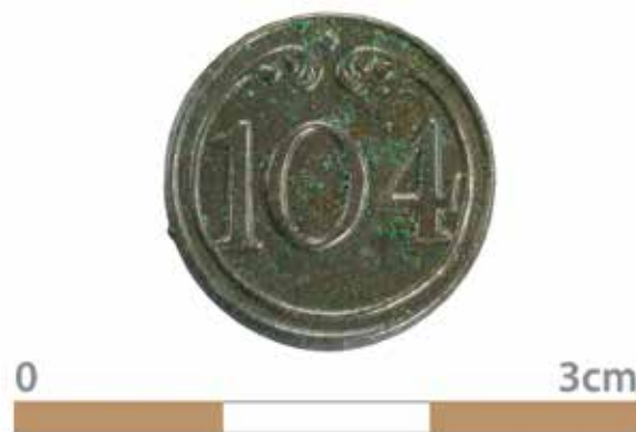
Afbeelding 3. Knoop 104 e demi-brigade.