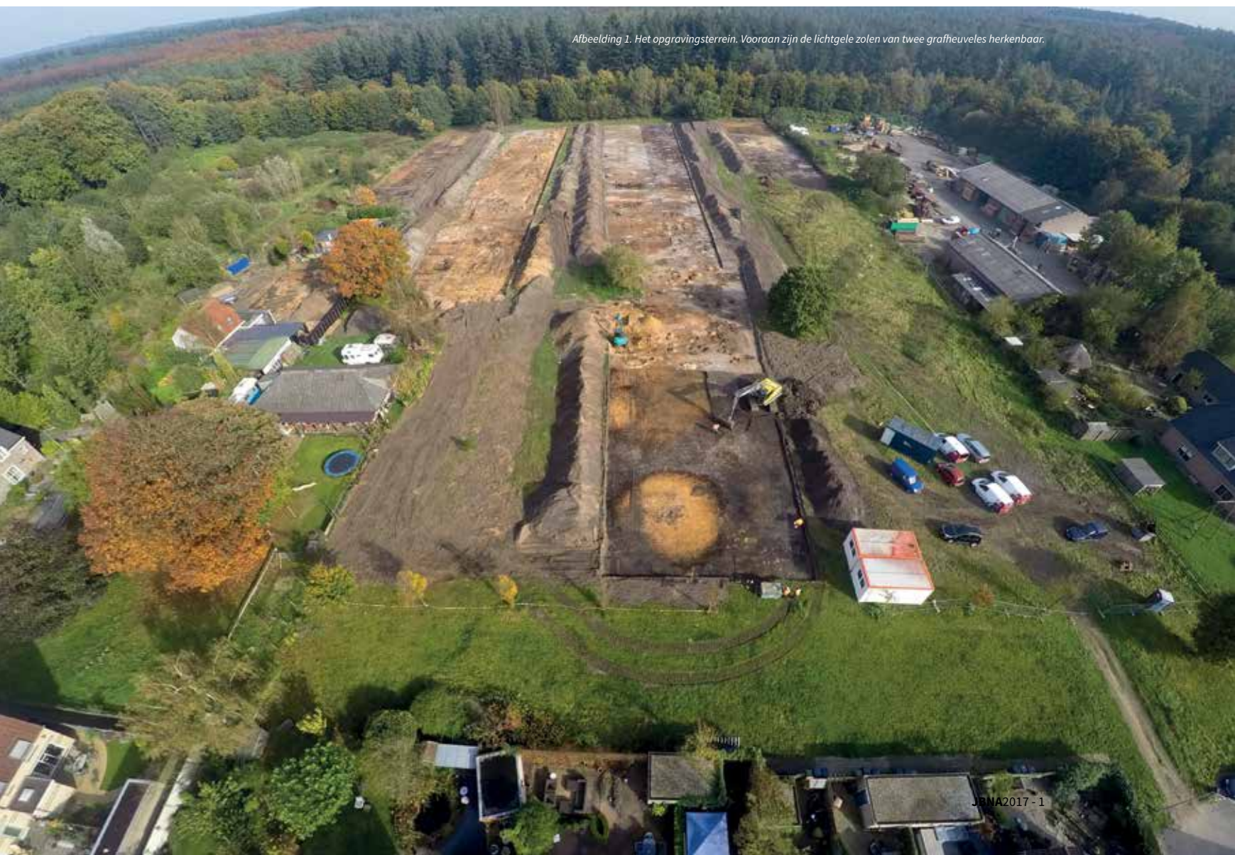
Afbeelding 1. Het opgravingsterrein. Vooraan zijn de lichtgele zolen van twee grafheuvels herkenbaar.

en later, vanaf 1810 – direct onder Napoleon - een onderdeel van het Franse keizerrijk. In wat tegenwoordig meestal de Franse tijd wordt genoemd, was naast het Nederlandse (of Bataafse) leger ook steeds een aanzienlijke Franse troepenmacht in ons land gelegerd. In het voorjaar van 1804 liet de Franse generaal Auguste de Marmont de helft van de Franse en Nederlandse troepen onder zijn bevel samenkomen op de heide bij Zeist, in wat het Camp d'Utrecht werd genoemd. Volgens Marmont was het leger onder ongezonde condities ingekwartierd in de steden en was het slecht getraind. Kamperen op de heide was gezond en gaf de mogelijkheid in verschillende verbanden te oefenen. Bij Zeist liet hij daarom – op kosten van de Nederlandse overheid - een groot, semi-permanent oefenkamp aanleggen, dat zich uitstrekte over een gebied met een lengte van circa 3 kilometer en een diepte van circa 1 kilometer. In het kamp werden drie divisies gelegerd: twee Franse en één Bataafs-Nederlandse, circa 18.000 man in totaal. Behalve militairen waren daarnaast ook ongeveer 2000 vrouwen en kinderen aanwezig.