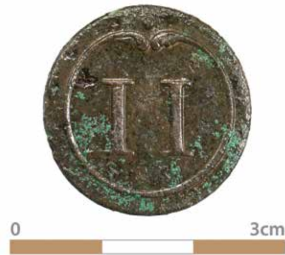
Afbeelding 2. Knoop 11 e regiment.

Het tentenkamp van Marmont op de heide bij Zeist werd aangelegd naar een vooropgezet plan en was strikt hiërarchisch ingericht. Marmont was trots op zijn kamp en liet daarom als relatiegeschenk een prachtige kaart hiervan vervaardigen. Op basis van deze kaart maar ook correspondentie, rekeningen van de aanleg en het onderhoud en verschillende beschrijvingen