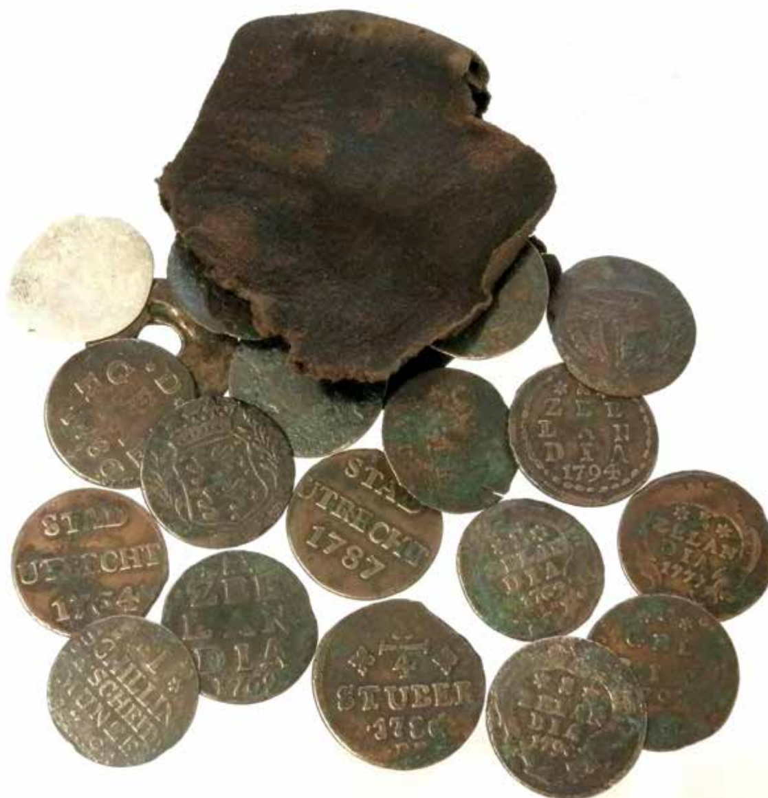
Afbeelding 19. Buidel munten.