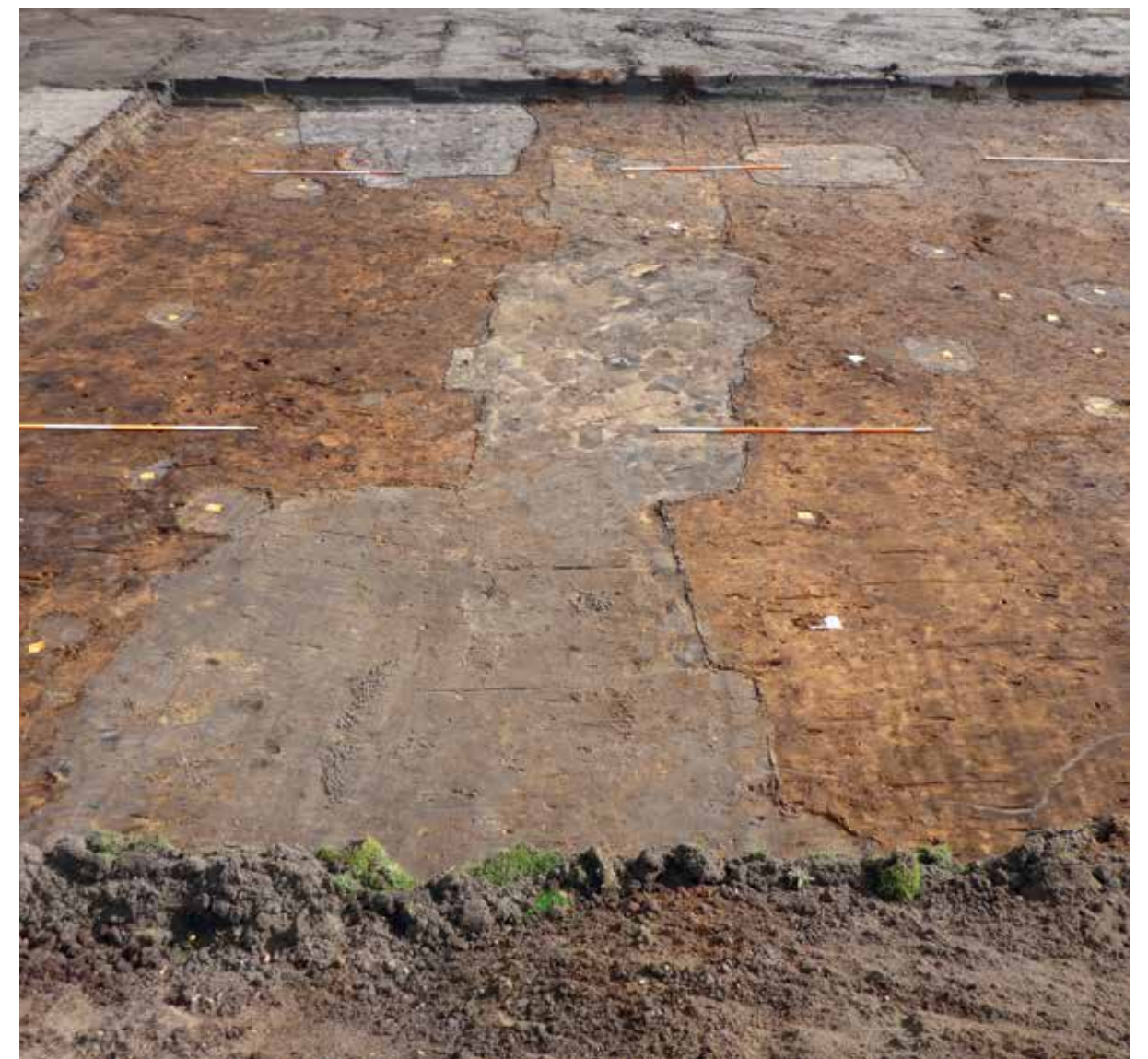
Afbeelding 6. Keukens.