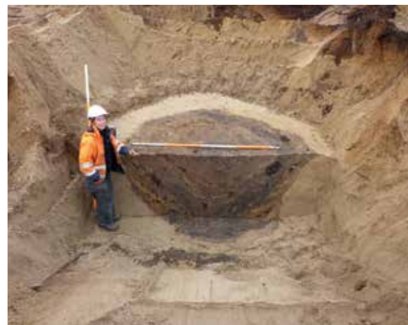
Afbeelding 11. Waterput.

Bijzonder is dat bij de officiersbarakken sporen werden gevonden die terug te voeren zijn op een binnenindeling. Opvallend is ook dat de meeste kuilen met baksteenpuin en