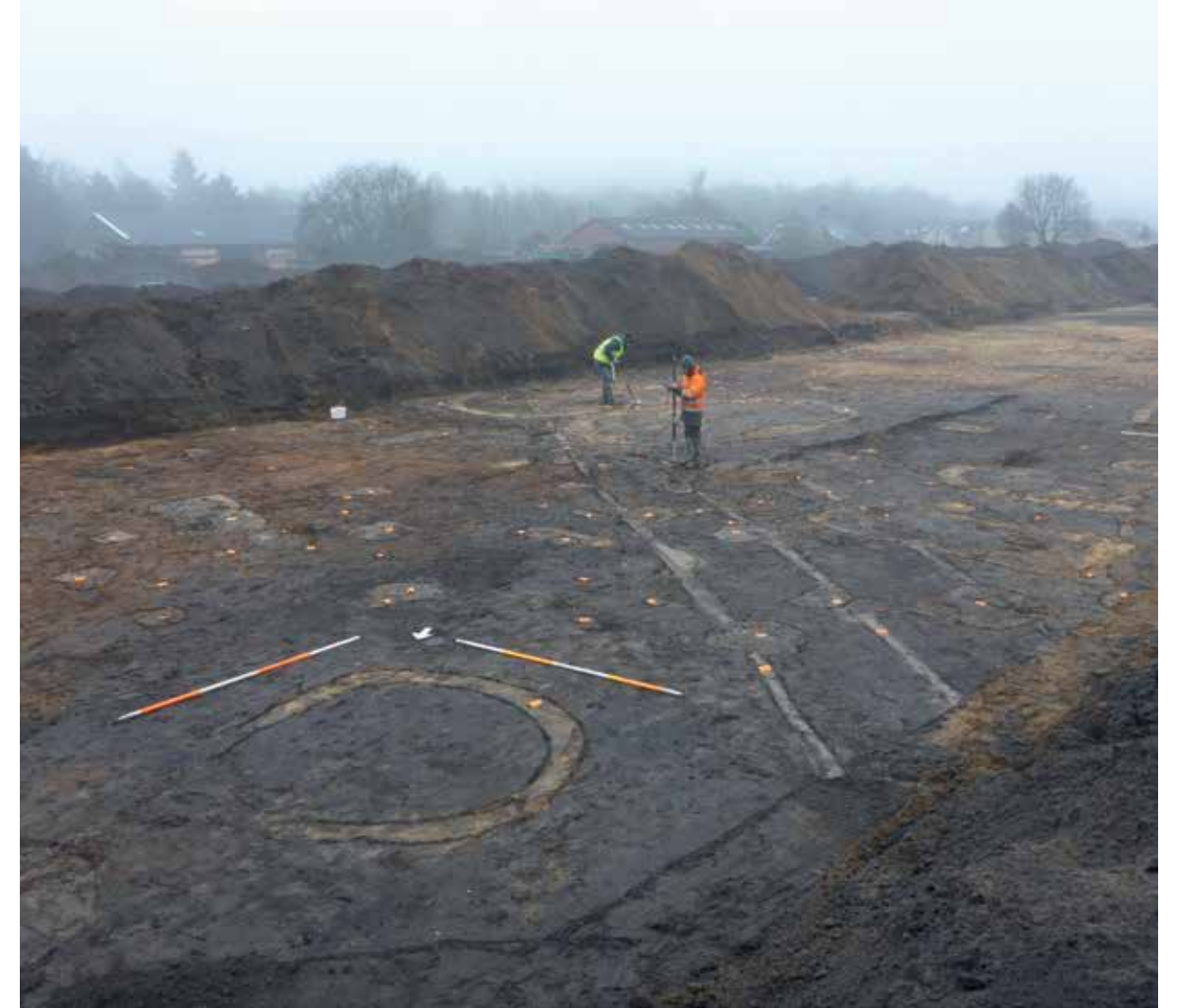
Afbeelding 5. Wapenmantel.