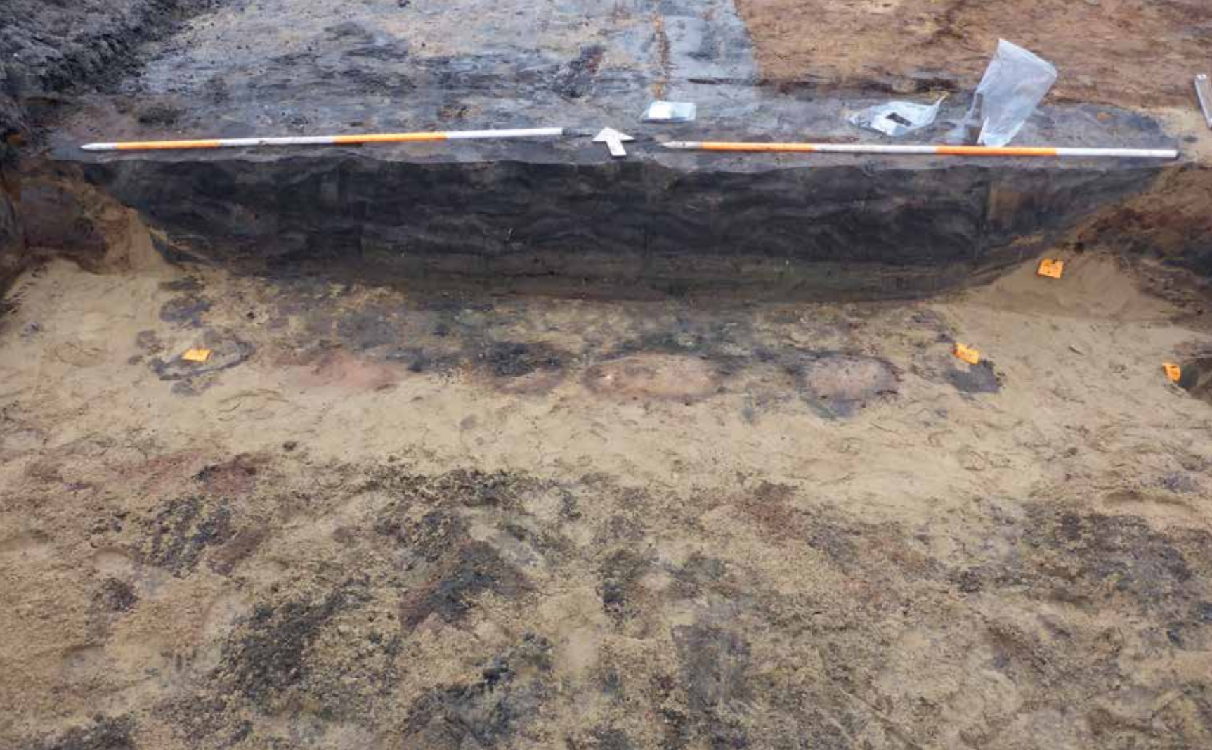
Afbeelding 10. Kookgat ofwel keuken.

tenten en geen houten gebouwen opgericht. Van de tenten zelf resteert inderdaad niets, maar tot verrassing van de opgravers bleek dat de tenten herkenbaar zijn aan de afwateringsgreppel die rondom een tent is gegraven (afbeelding 8). Door de vorm en afmetingen van de afwateringsgreppels is bekend welke afmetingen en vorm de tenten hadden. De soldatententen hadden aan beide zijden halfronde uiteinden en waren 5 bij 3 meter groot. Interessant is dat de vorm en afmetingen niet overeenkomen met het standaardtype tent zoals beschreven in instructies uit die tijd. De tentgreppels maken het ook mogelijk de inrichting van het tentenkamp in groot detail te reconstrueren. De soldatententen bleken paarsgewijs en vijf rijen diep opgesteld te zijn geweest. Uitgaande van de voorlopige reconstructie van het tentenkamp bevonden zich tussen twee noord-zuid georiënteerde kampstraten 80 tenten. Over het aantal soldaten dat in een tent onderdak vond, bestaat veel discussie. Uitgaande van 8 tot 10 personen per tent, zou binnen het tentenblok een bataljon (640 à 800 man) gelegerd kunnen zijn geweest. In hoeverre deze berekeningen kloppen zal nader onderzocht moeten worden.