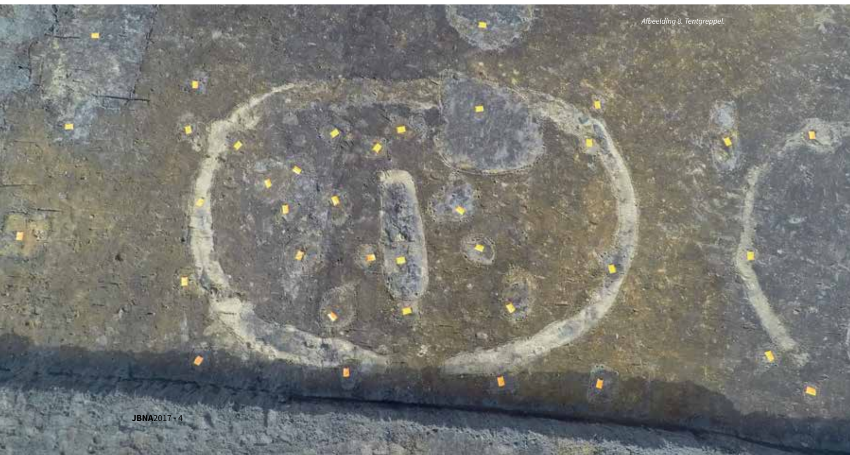
Afbeelding 8. Tentgreppel.

Voorafgaand aan het onderzoek was de verwachting dat veel sporen uit het eerste jaar van het kamp slecht bewaard zouden zijn gebleven; in deze eerste fase werden namelijk alleen