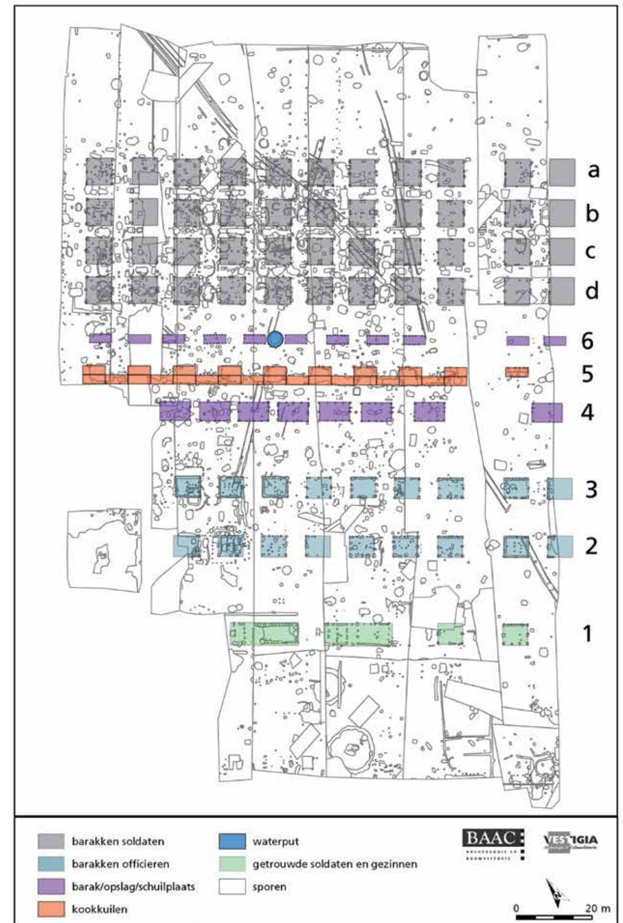
Afbeelding 9. Barakkenfase.