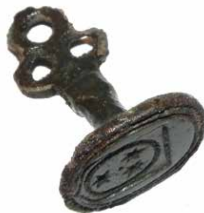
Afbeelding 17. Zegelstempel.