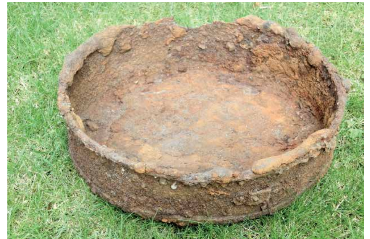
Afbeelding 12. Gamelle, eetpan. Uitleg: in dit soort dingen werd niet gekookt; dat gebeurde in een marmite. (=kookpot). Na het koken in de "marmite" werd de soep in de "gamelle" overgegoten en geserveerd.

losse bakstenen ter hoogte van de officierslinies zijn gevonden (afbeelding 8). Dit lijkt erop te wijzen dat de officiersbarakken voorzien zijn geweest van bakstenen schoorstenen. Dakpannen ontbreken onder het vondstmateriaal en dat maakt duidelijk dat de historische vermeldingen van pluggen en stro als dakbedekking kloppen.